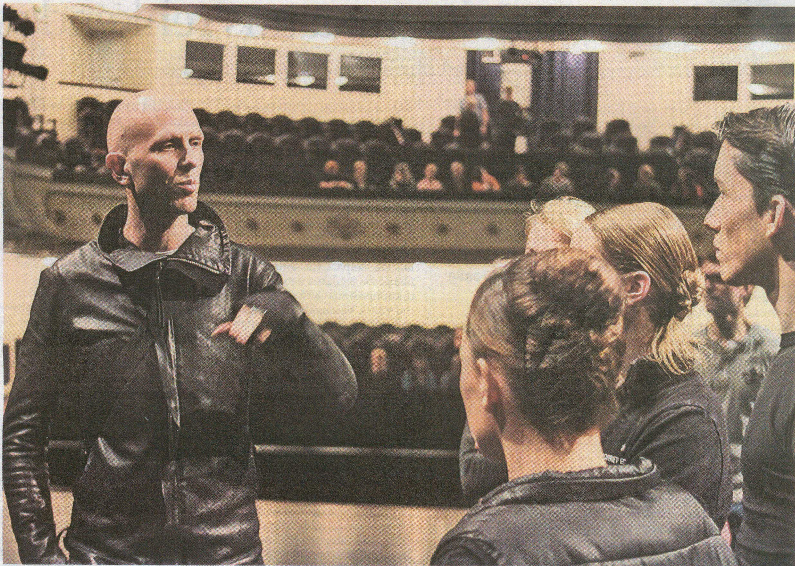
Briti tippkoreograaf Wayne McGregor koos tantsijatega eile Estonias «Symbiont(s)» proovis.