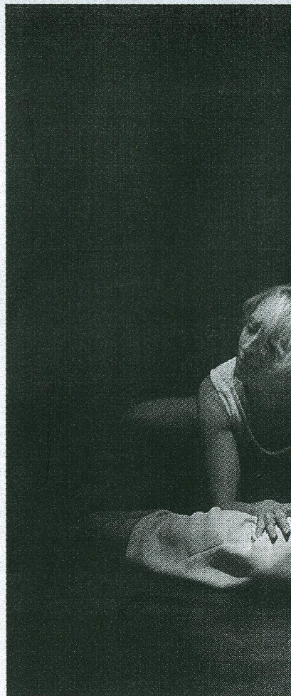
Балетный спектакль «Оборотень»