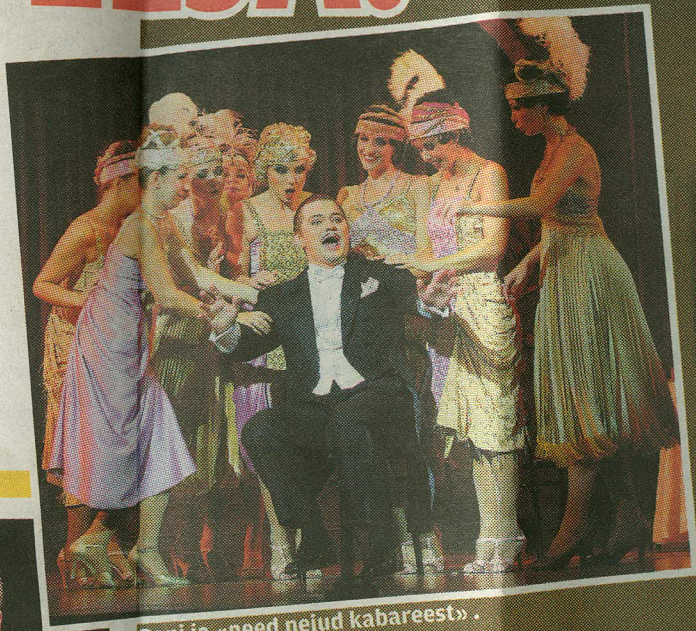
Boni ja «need neid kabareest».