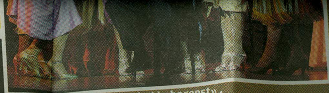
Boni ja «need neiud kabareest».

Usun, et tulen järgmisel aastal tagasi. Tallinnas on tore!