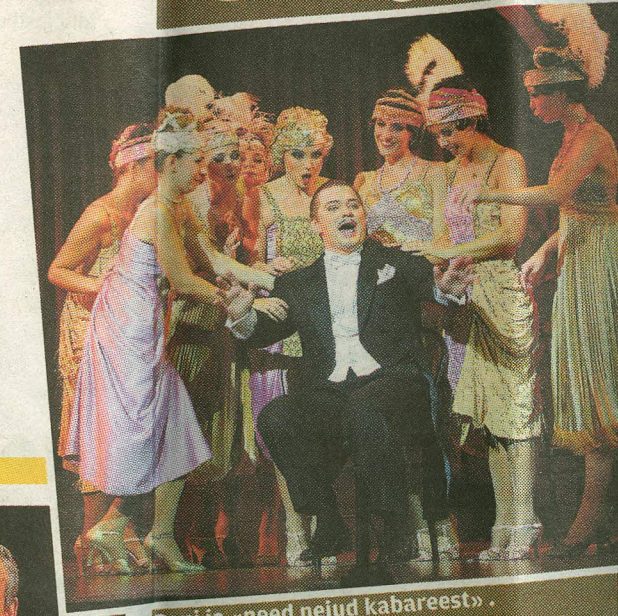
Boni ja «need neiu kabareest».

mind Tallinna ja käis ise paar korda Viinis. Saanud teada, et olen näitleja, ütles ta kord, et hakkab «Silvat» lavastama ja pakub mulle selles osa. Mina vas-