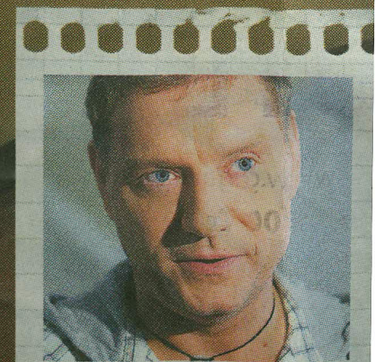
«Silva» - Mart Ganderi