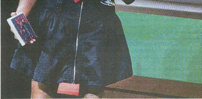
Teatrihooaja avab sel reedel Eesti Draamateatris Vanemuine uulavastusega – «Kaos»

Selle aasta novembrist aga kuuleb erinevates Eestimaa kontserdipaikades linnateatri näitlejaid esitamas Olav Ehala, Valter Ojakäär, Uno Naissoo ja mitme teise armastatud eesti helilooja loomingut.