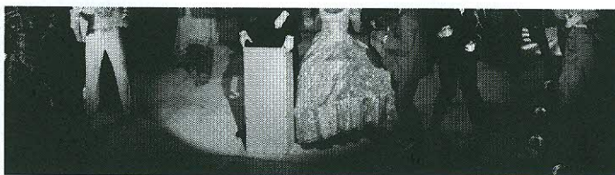
A II. felvonás karneváli Cirkusz-jelenete

Brecht epikus színházának, nem tagadva meg annak erős politikai-ideológiai vérvonalát sem, zeneileg pedig a Schönberg-Berg által kidolgozott színpadi expresszionizmust elegyíti, teszem azt, a Pink Floyd vagy a Genesis, netán a King Crimson nevű egykori rock-bandák úgynevezett progresszív hangvételével. Veszélyes keverék, amely egy tehetségtelegebb rendező kezében könnyen mérgezővé válhat. Nem így történt.