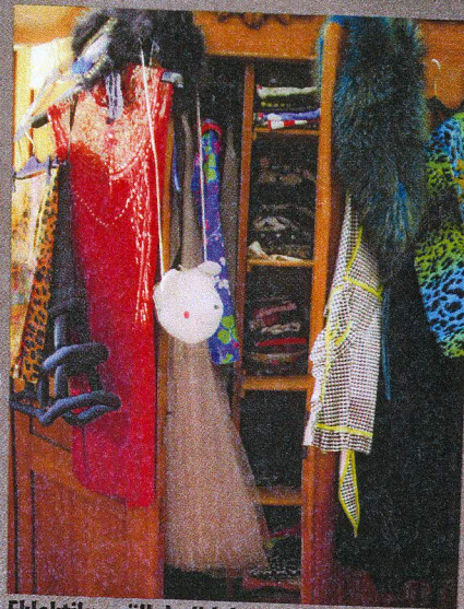
Eklektika möllab riidekapis litritest neonvärvideni ja tagasi.