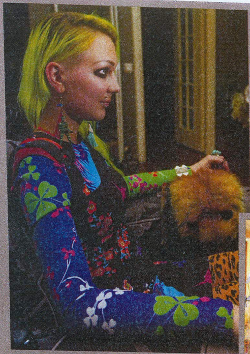
Kleit Versace for H&M. "Selles kleidis on rohkem värve kui 80ndates. Täiesti jabur!"