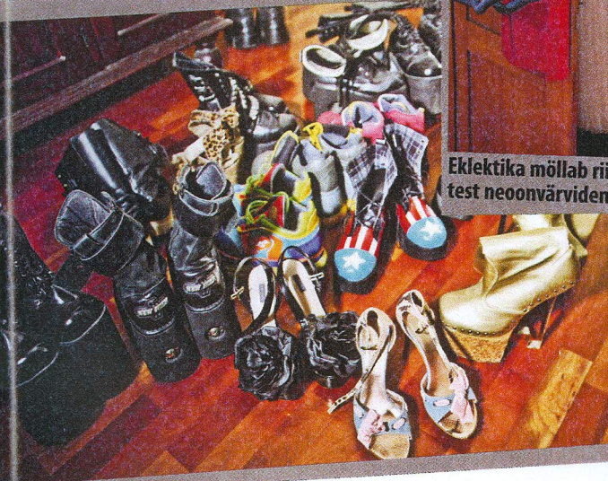
Platvormsaapad kuuluvad Grete igapäevaste jalanõude hulka. Vahel õnnestub tal siiski ka kingakesed jalga meelitada.