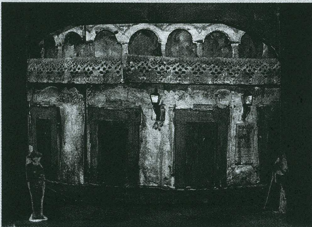
Liina Keevalliku lavakujundus Bizet' ooperile „Carmen”. Fotod maketist.