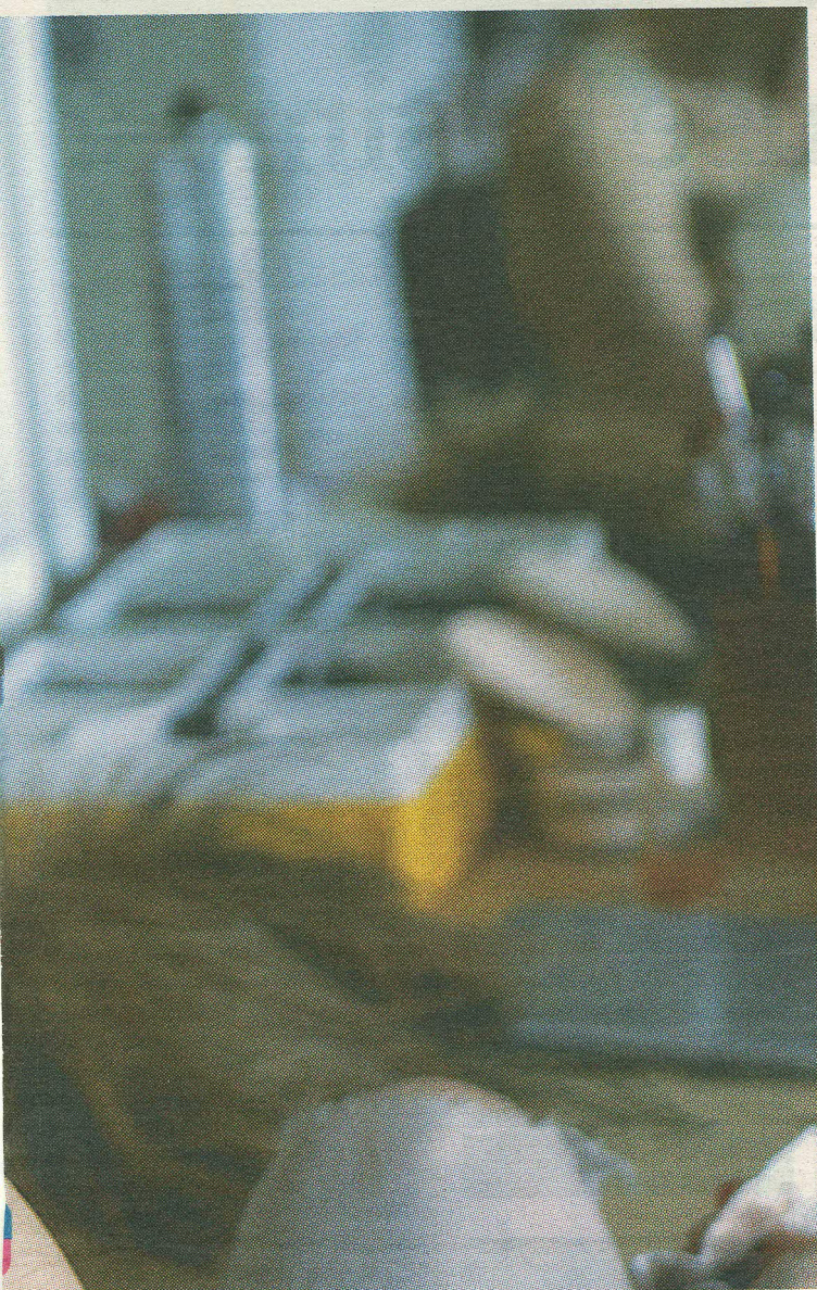
Naeratab, aga päris rahul ei ole. Nõudlik nagu ta on.