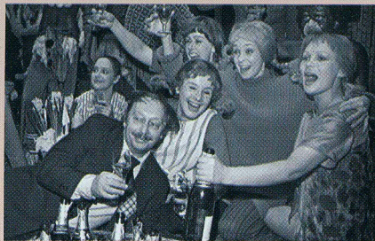
„Pipi Pikksuka“ esietenduse järgne koosviibimine, 1969.