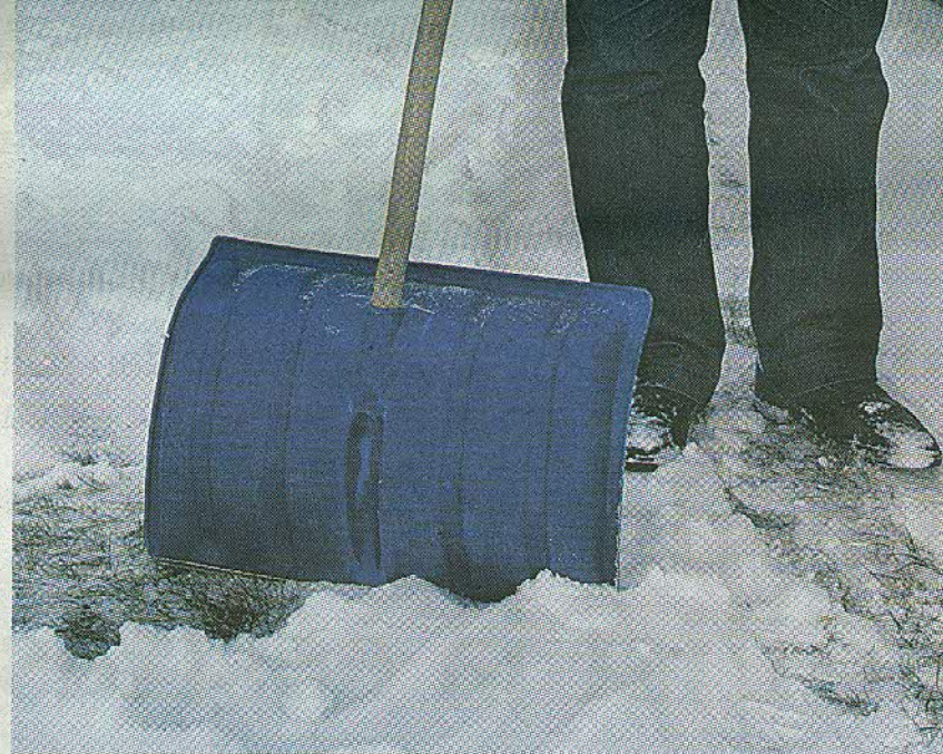
Eri Klas kodus ühes lund lükkamas.

Eri Klasi elutööd on väärtustatud. Teades, kuidas ta mitu varasemat preemiat on jaganud heategevuseks, küsin lõpetuseks, mida ta seekordse preemiaga ette võtab. «Paraku on nii, et seesama valitus, kes mind preemiaga austab, on hoolitsenud ka selle kulutamiskoha eest,» möönab Klas talle omase leebe ironiaga. «See raha läheb maja kütmiseks.»