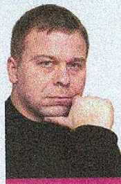
TEKST VERNI LEIVAK