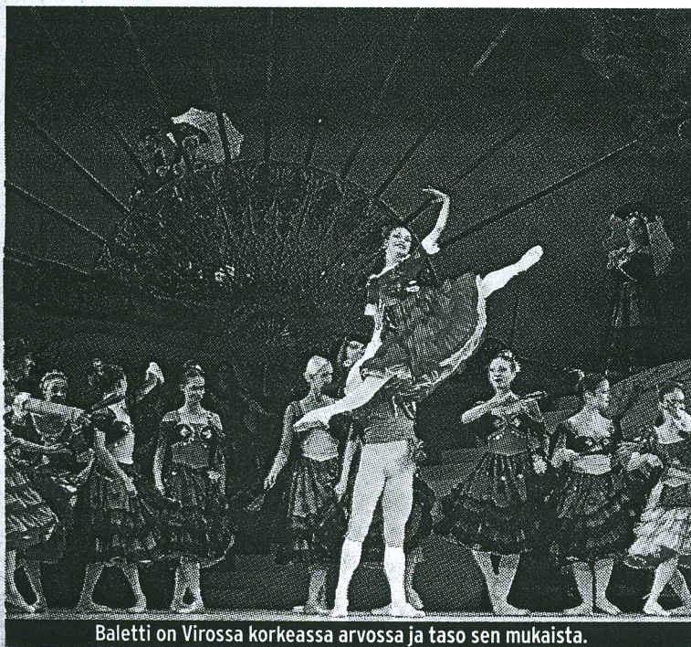
Baletti on Virossa korkeassa arvossa ja taso sen mukaista.

nähdään muun muassa lastenbaletti Lumikki ja seitsemän kääpiötä. Kun vielä poimitaan syyskuun kalenterista kaksi operettia: My fair lady ja Wieniläisverta, voidaan todeta, että Estoniassa kausi polkaistaan käyntiin tutun monipuolisesti ja laadusta tinkimättä.