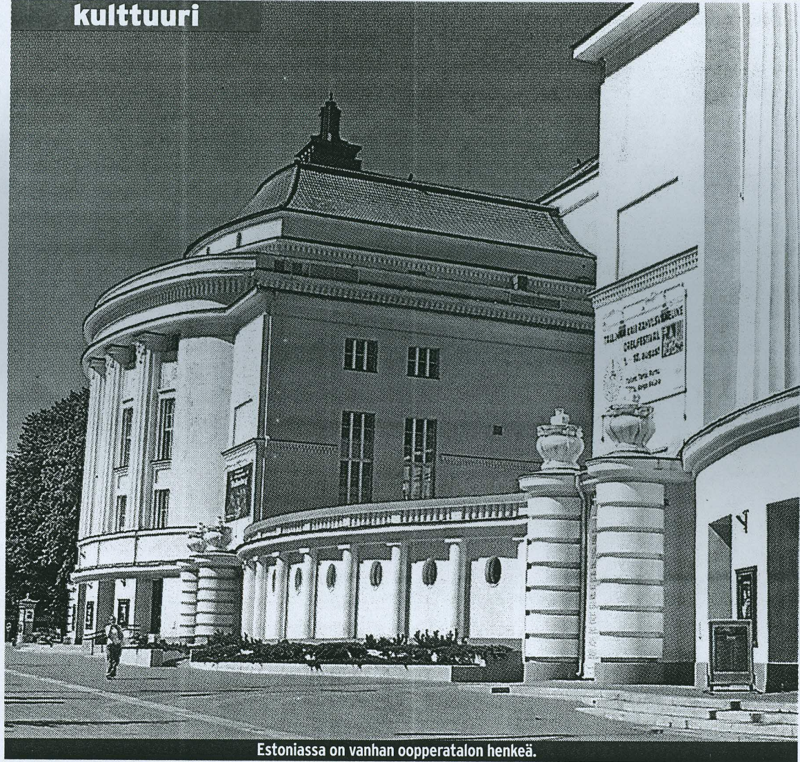
Estoniassa on vanhan oopperatalon henkeä.