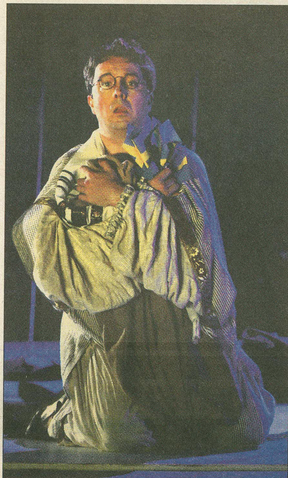
Рауль Валленберг в исполнении Эспера Таубе – все эмоции читаются во взгляде.