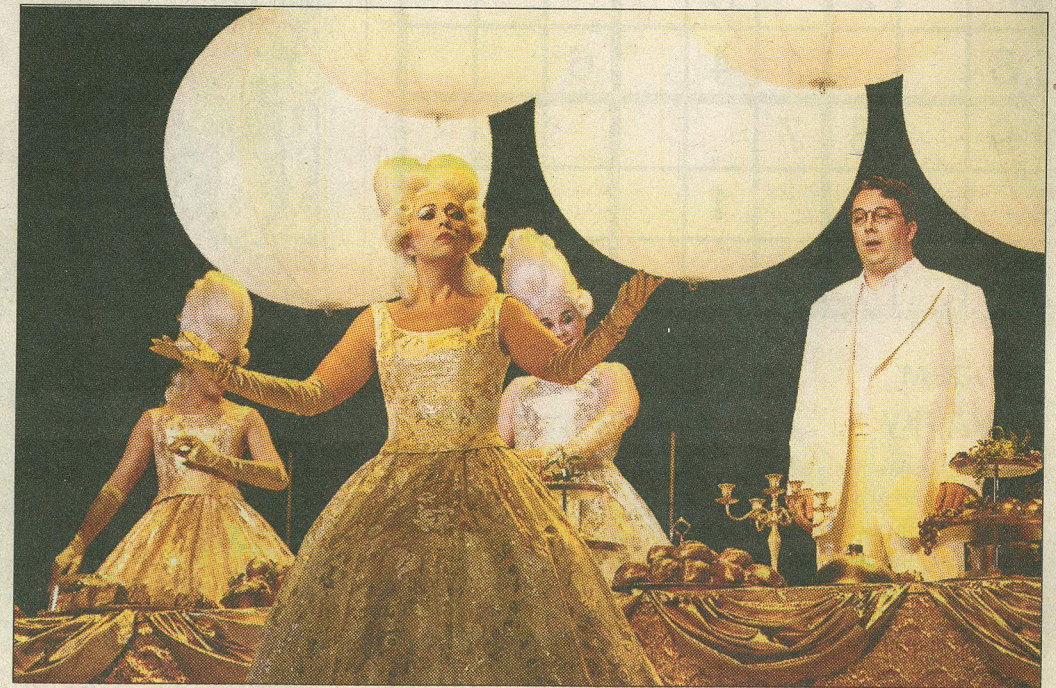
Героиня Рийны Айрене на дипломатическом балу — ничто не предвещает беды.