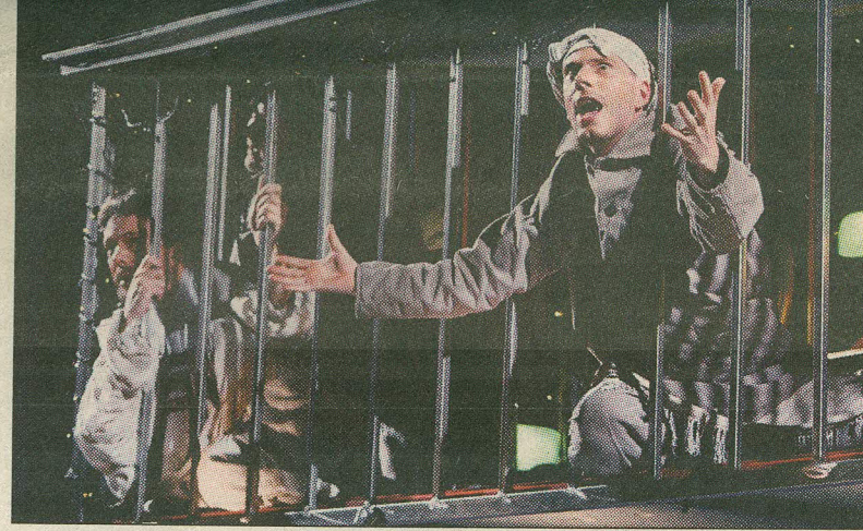
За решеткой сходишь с ума.

Премьера «Валленберга» прошла в 2001 году в Дортмундском оперном театре, по чьему заказу она и была написана. Однако постановка сильно отличаются друг от друга: дортмундский спектакль показался Дмитрию Бертману слишком натуралистичным. «Понимаете, публика зачастую прихо-