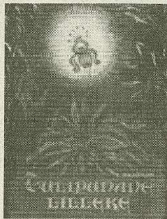
Sergei Aksakov "Tulipunane lilleke"