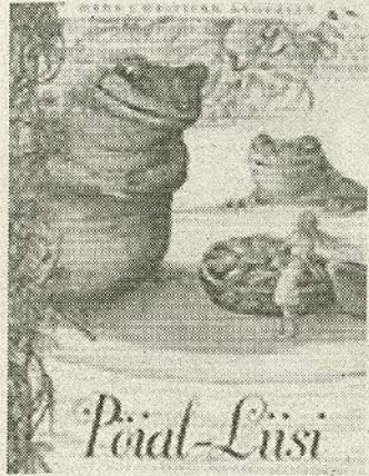
Hans Christian Andersen "Pöial-Lüsi"