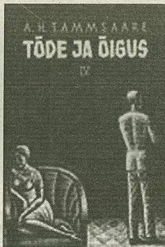
Anton Hansen Tammsaare "Tõde ja õigus" IV ("Karin ja Indrek")