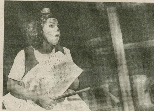
„Lottes” näitas Padar end toreda artistina.

ambitsioone. Mida aga nägi või kuulis laps? Ühel hetkel tekkis tunne, et nii mõnigi laps on pehmelts öeldes „kärü pealt maas”. Ja mis siin imestada, sest miks peaks üks laps teadma, mida tähendab Guinnessi rekordite raamat või mõni veelgi keerulisem asi. Aga võib-olla oli asi hoopis muus. Näiteks minule, täiskasvanud kuulajale, valmistas tõsiseid raskusi mõista, mida näitlejad laval laulavad, sest tekstist oli kohati võimatu aru saada (probleem, mida „Lottes” polnud). Samas, mine tea, ehk haaraski lapsi pigem särav visuaal mitte