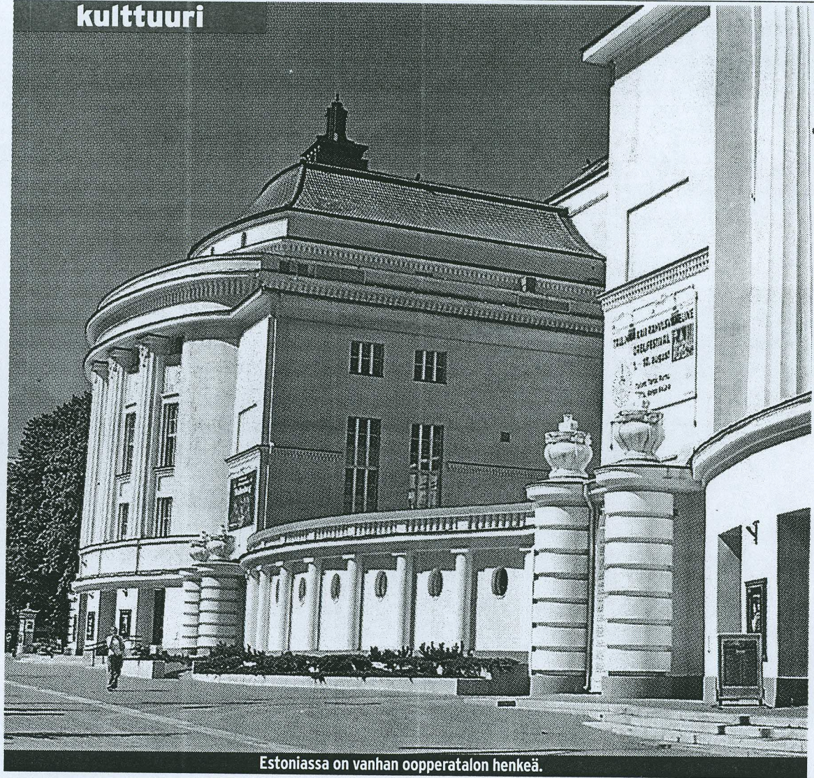
Estoniassa on vanhan oopperatalon henkeä.