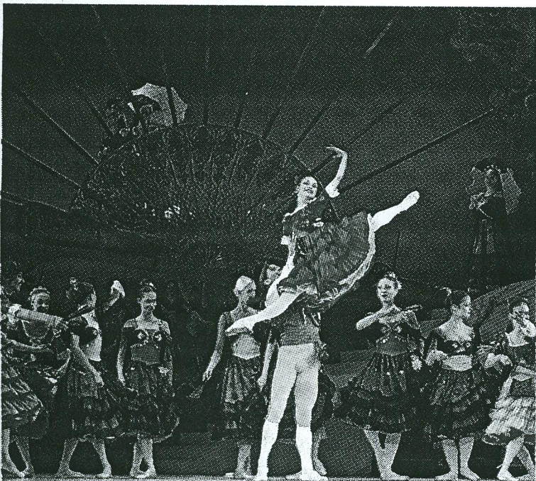
Baletti on Virossa korkeassa arvossa ja taso sen mukaista.

nähdään muun muassa lastenbaletti Lumikki ja seitsemän kääpiötä. Kun vielä poimitaan syyskuun kalenterista kaksi operettia: My fair lady ja Wieniläisverta, voidaan todeta, että Estoniassa kausi polkaistaan käyntiin tutun monipuolisesti ja laadusta tinkimättä. ■