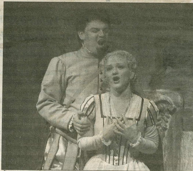
Õuenarri vouruslik tütar Gilda on oma südame juba kaotanud

1850. aasta aprillis kirjutas Giuseppe Verdi alla lepingule, mille kohaselt ta nõustus Veneetsia järgmise aasta karnevalihooajaks kirjutama täiesti uue ooperi. Olemas oli ka kirjandusteos, mille järgi ooper pidi loodama. See oli Victor Hugo „Kuningas lõbutseb“. Kuna ooperis oli kesksel kohal needus ja et mitte kasutada originaalpealkirja, otsustati ooperile nimeks panna „Saint