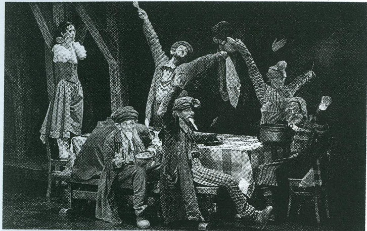
Andekalt lavastatud päkapikustseenid, «Lumivalgeke ja 7 põialpoissi».