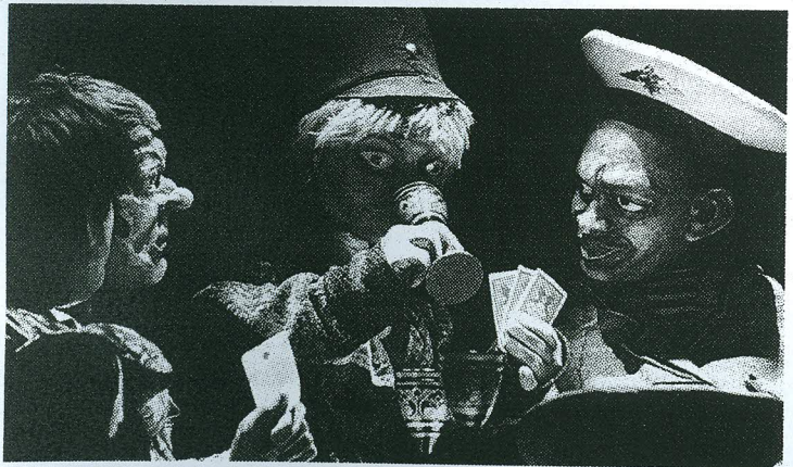
«Mängurid»: täiskasvanute nukulavastus, mis paistis silma kolmes eri suuruses nukudega.