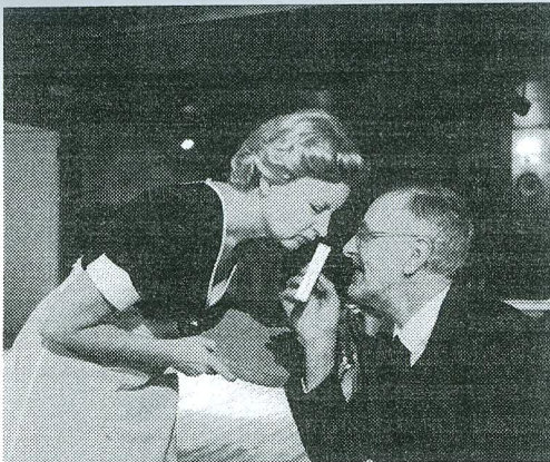
„Lõputu kohvijoomine”, Eesti Draamateater. TEET MALSROOS

„Lumivalgeke ja 7 põialpoissi”, rahvusooper Estonia. HARRI ROSPU