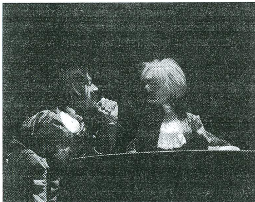
„Mängurid”, Eesti Nuku- ja Noorsooteater. NUKUTEATER