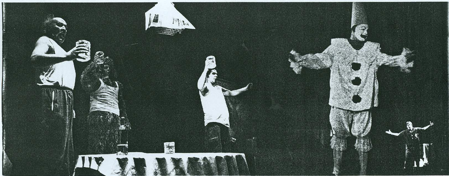
Ooperis "Kosjas" oli Steineril idee tuua lavale sellised tegelased, kes laval üldiselt ei käi, näiteks maika väel viinaklaasiga mees. Steenid ooperist.

Selle ooperi puhul on kriitikud ajakirjanduses sulle ette heitnud muusika illustratiivset osa. Millega sa ise põhjendad neid valikuid, millised olid sinu loomingulised eesmärgid?