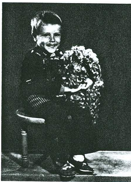
Tulevane heliartist (4-a).

Suhtun nendesse äärmiselt avatult, kuulan suure rõõmuga. Iseasi, kas need kõik jõuavad minu muusikasse. Mulle meeldib rohtult kuulata rahvamuusikat. Siis olen kriitikapiirist täiesti vaba. Seda ootaksin kindlasti inimestelt ka näiteks nüüdismuusi-