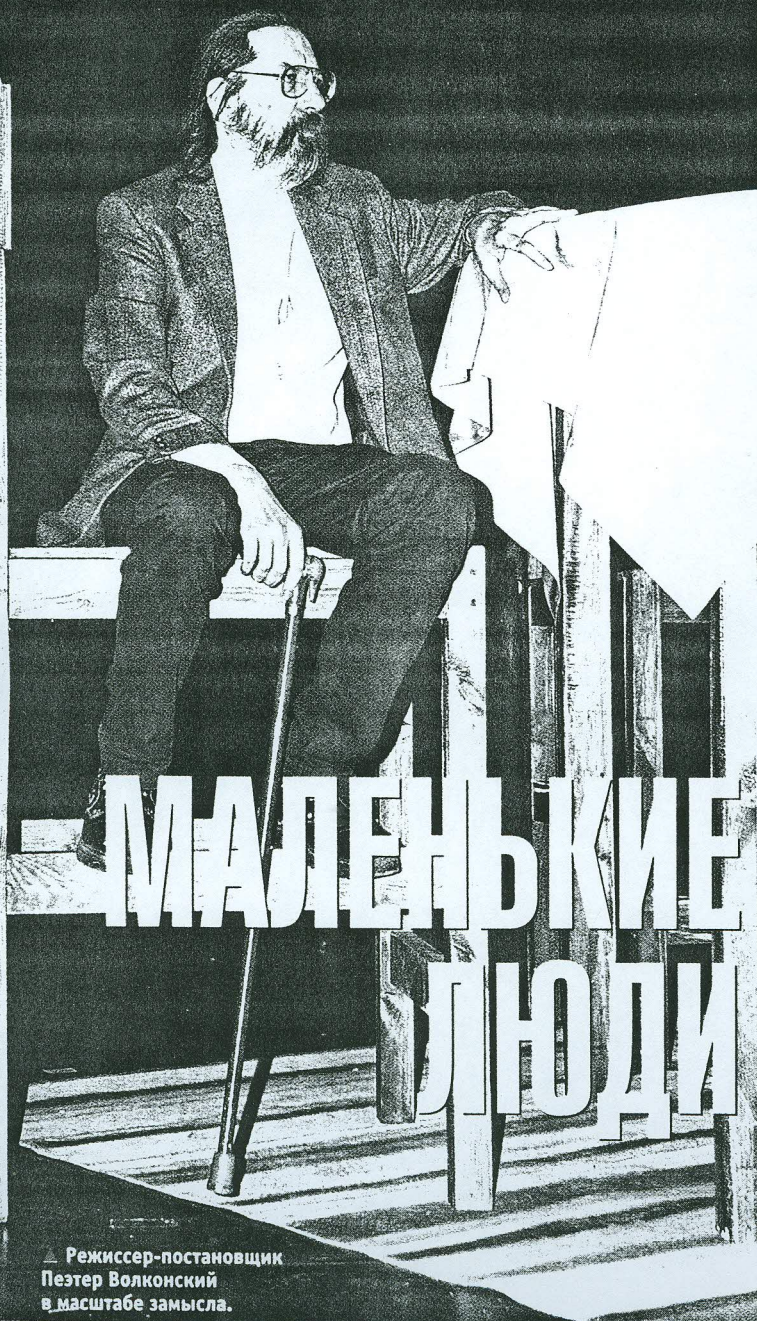
▲ Режиссер-постановщик Пеэтер Волконский в масштабе замысла.