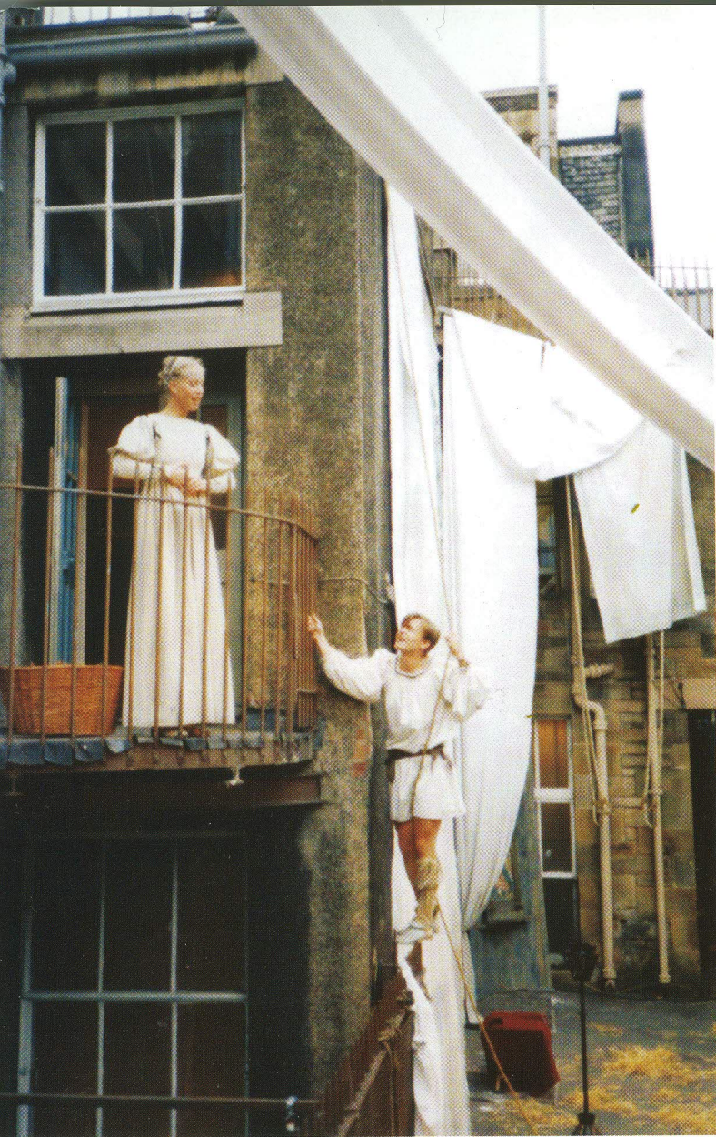
Linnateatri Romeo ja Julia 1994. aastal Edinburghis.