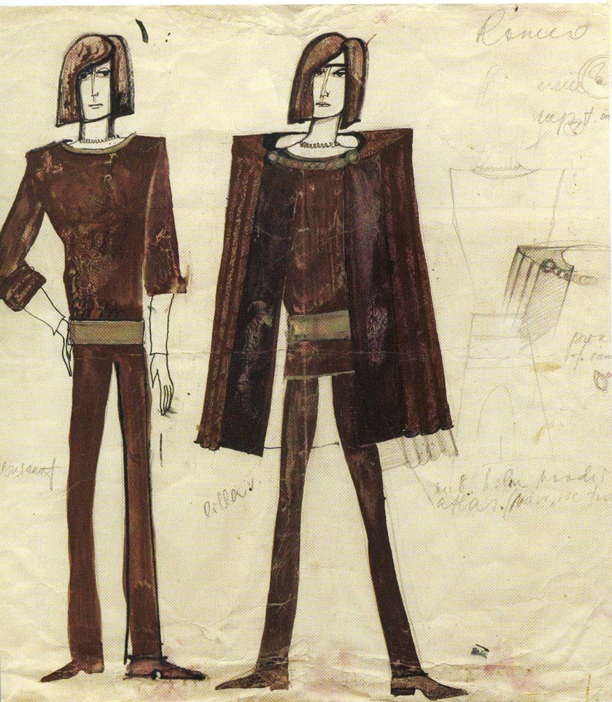
Undi kostüümikavandid 1969. aasta Noorsooteatri lavastusele.