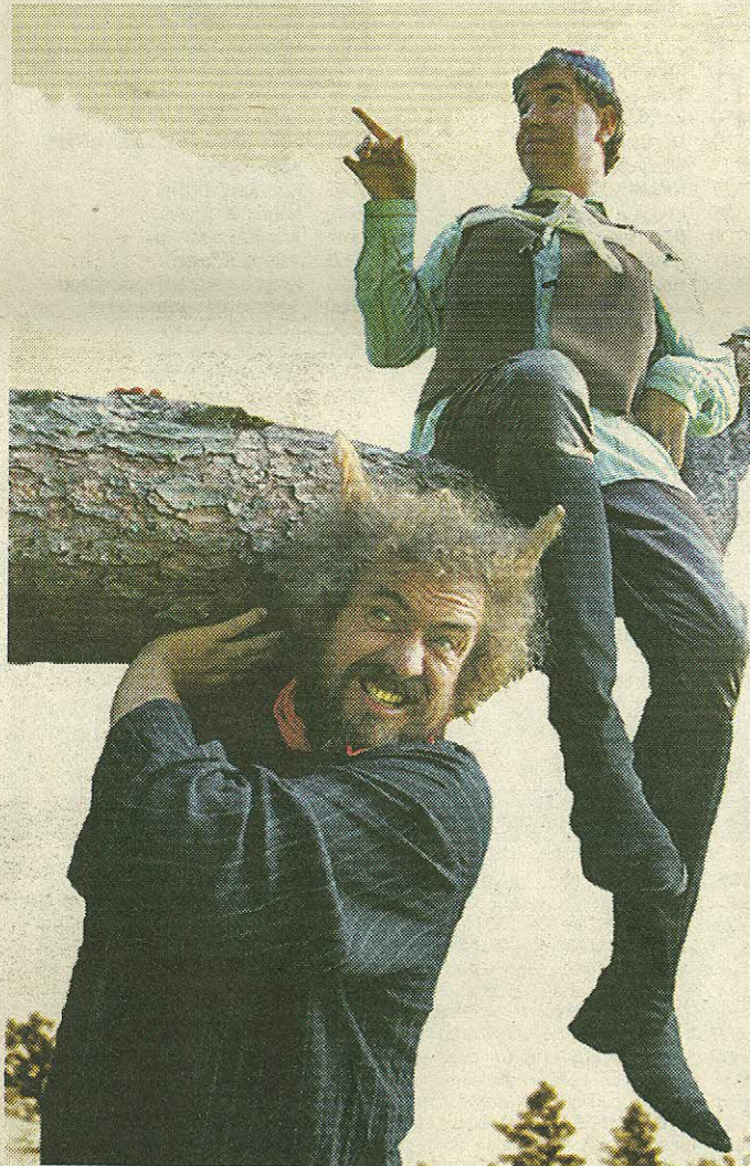
Väikese aru ja suure rammuga Vanapagan ning muretu ja taibukas Kaval-Ants Endla teatri jõulutükist.

Jõululavastuses osalevad Vanemuise ooperikoor, sümfooniaorkester ning Vanemuise tantsu- ja balletikooli õpilased ning Miina Härma gümnaasiumi lastekoor.