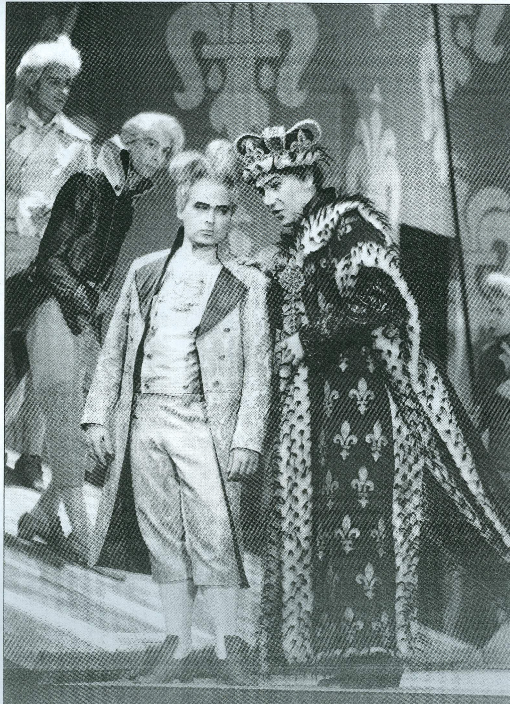
2xФото Станислава Мошкова

Впрочем, несмотря на жестокую судьбу главной героини, всплакнуть нам все равно не придется, ведь либреттист Якобо