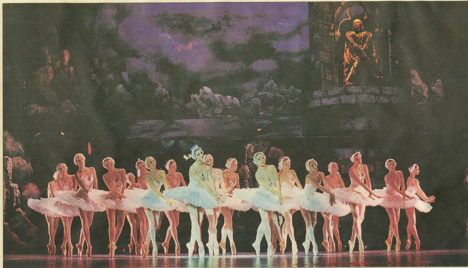
Viie «Luikede järve» etendusega Malmös esinenud Estonia teatri balletitrupp demonstreeris tehniliselt väga head tantsu.