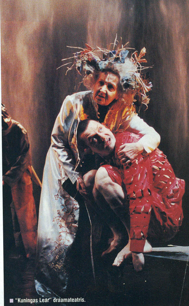
■ "Kuningas Lear" draamateatris.