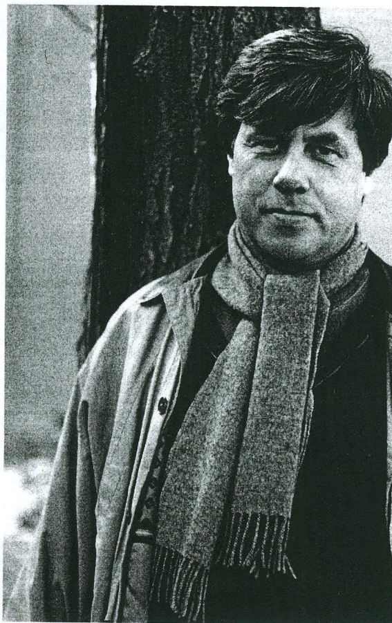
Paul Hillier – laulja, dirigent, muusikakirjutiste autor, alates möödunud sügisest Eesti Filharmoonia Kammerkoori peadirigent ning koos Tõnu Kaljustega festivali "Vox est fest 2001" kunstiline juht.