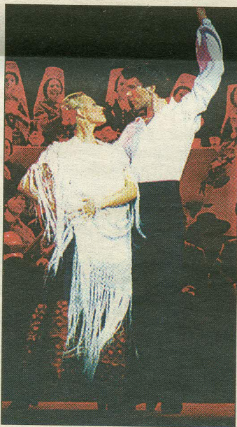
«Lühikese elu» kulminatsiooniks kujunes mõneminutiline tantsunumber.

Ooperit mängitakse kokkuleppel agentuuriga Editions Max Esching ning loodetavasti on seda kevadel taas võimalik näha.