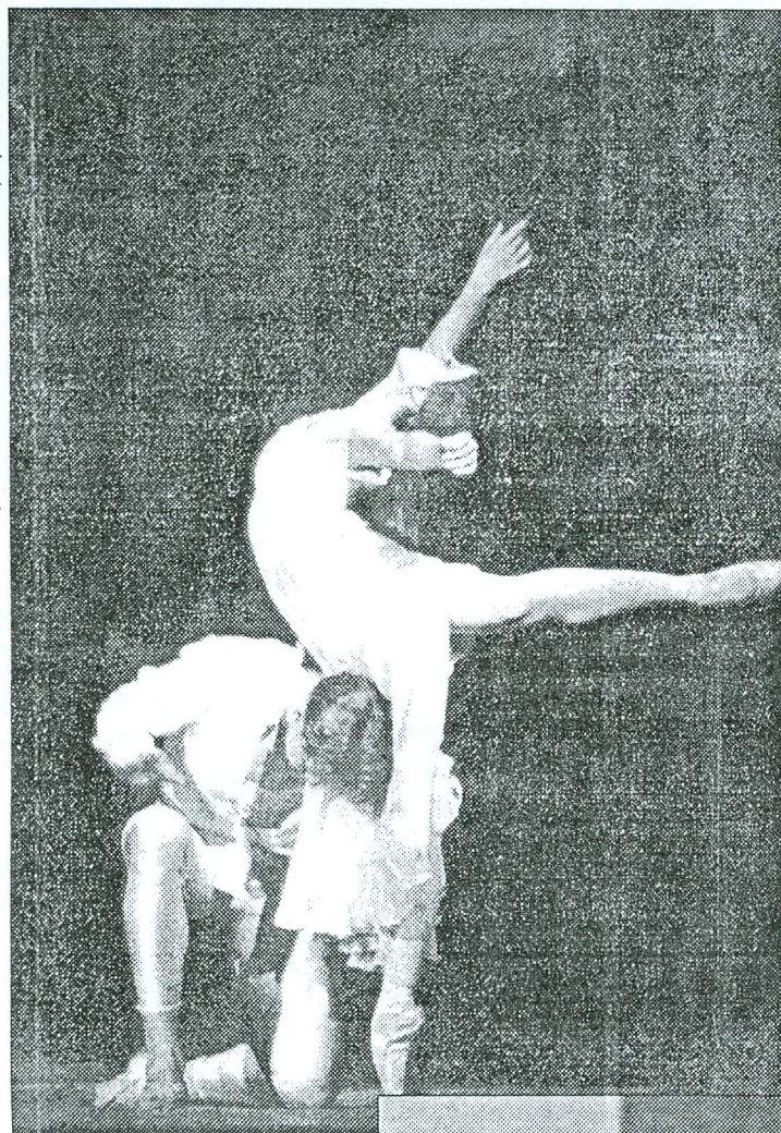
Romeo ja Julia laval...