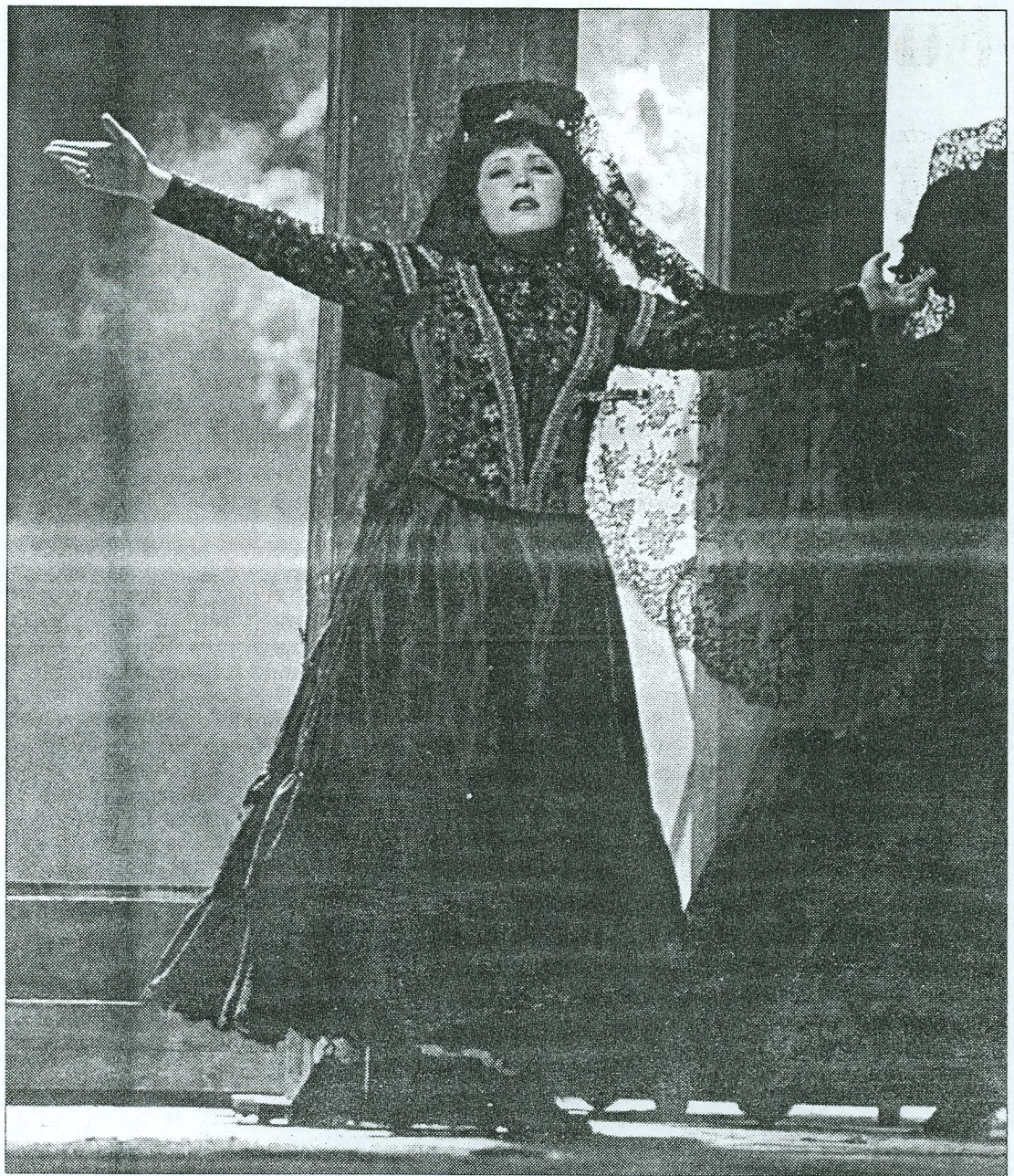
Carmeni sõnum maailmale: jätke liblikad vabadesse, eriti kui te neid armastasite!