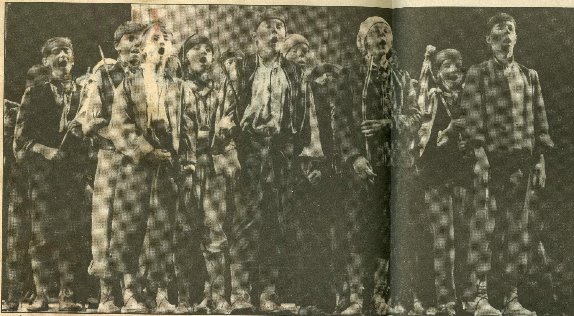
■ Poistekooril on "Carmenis" suur roll.