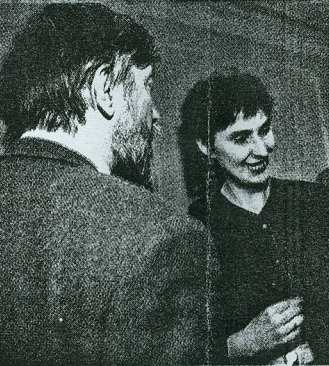
... ja ooperikomponist Lepo Sumera koos klaveriõpetajast abikaasa Kerstiga maitsmas prantsuse punaveini.