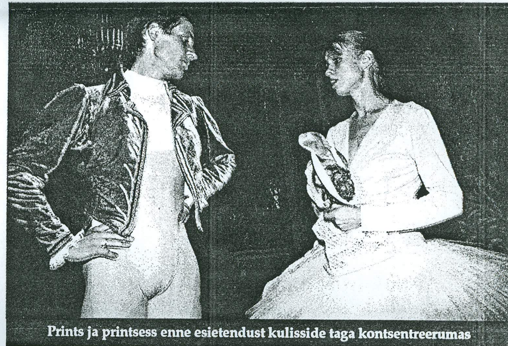
Prints ja printsess enne esietendust kulisside taga kontsentreerumas

vaatajale sisseelamisvõimaluse ka kunstniku (Riina Vanhanen) töösse. Stiilne klassikaline ballett uhkete dekoratsioonide ja säravate kostüümidega.