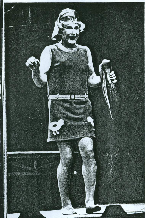
“Sugar” räägib kahest töötust muusikust, kes naisteks maskeerituna naisteorkestris tööd leiavad ning pikantsetesse sekeldustesse satuvad. Tõnu on terve elu naise rolli tegemisest unistanud, nüüd on tal see võimalus olemas.