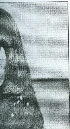
Brjussovi romaani ja tantsijalt.