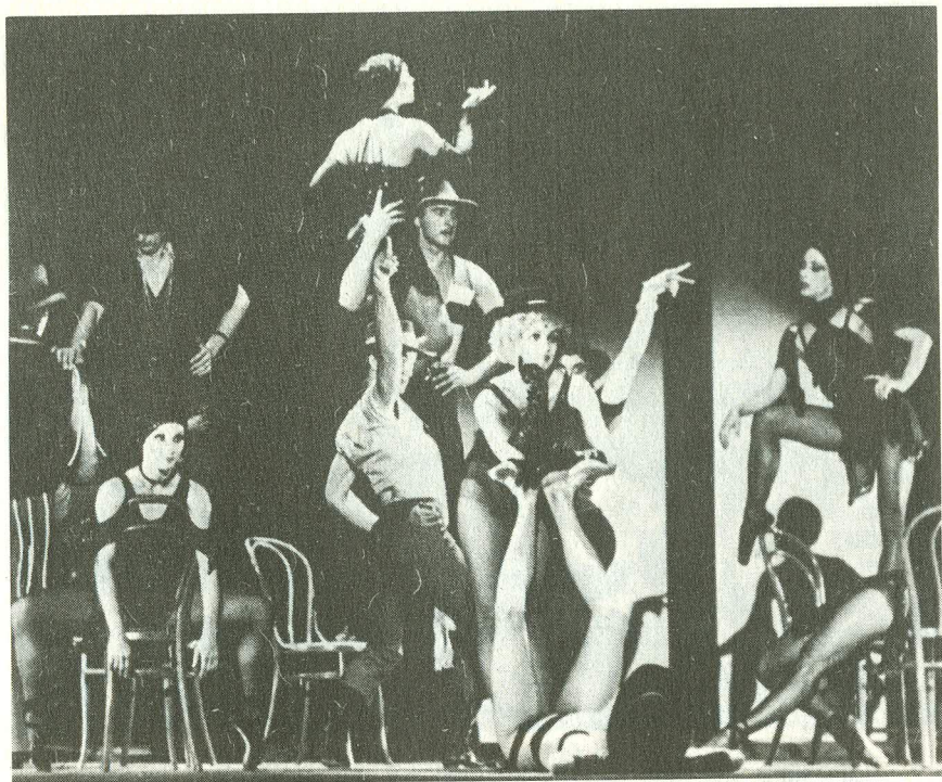
"Variatsioonide" esmalavastus Budapesti Ooperi laval 1978. a.

A scene from the first production of Variations at the Budapest Opera in 1978