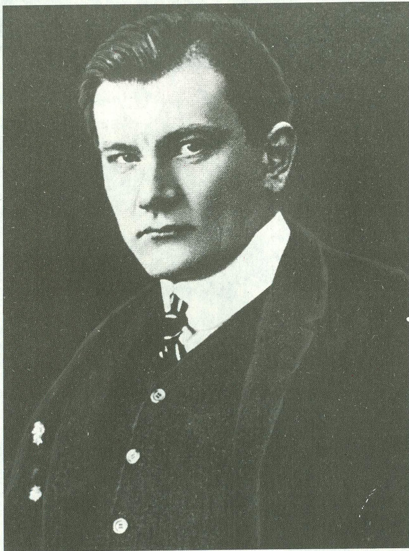
Ernö von Dohnányi (1877—1960)