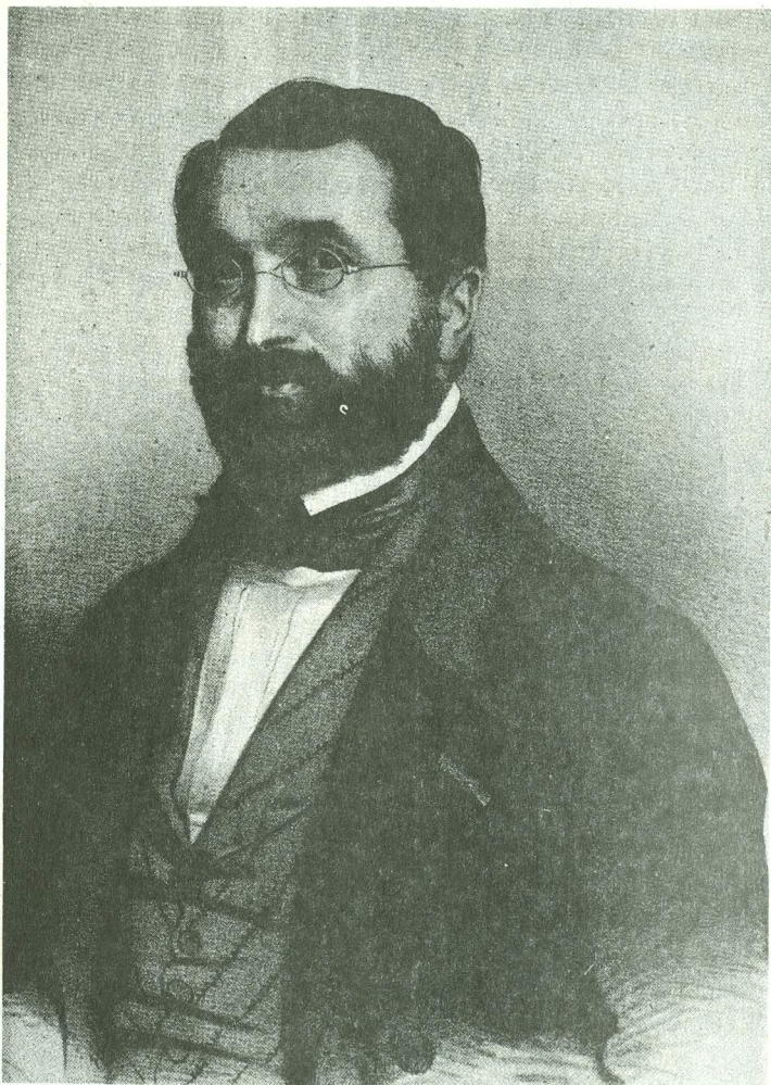
ADOLPHE ADAM (1803 - 1856)