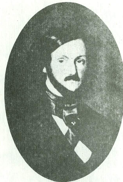
Jules-Henri Vernoy de Saint-Georges.