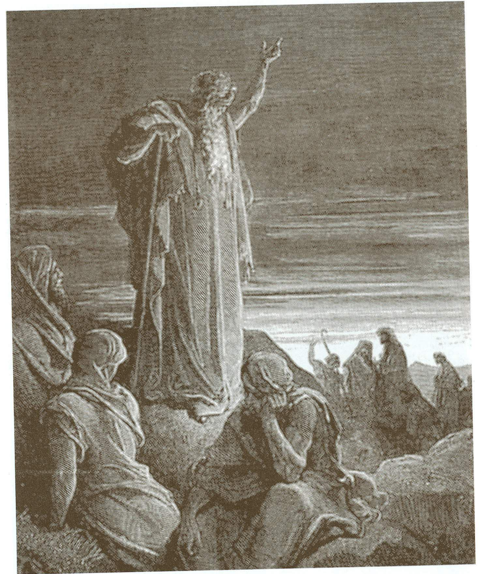
Ettekuulutus (Gustave Doré)

Zaccaria kuulutab ette Babüloonia hukku.