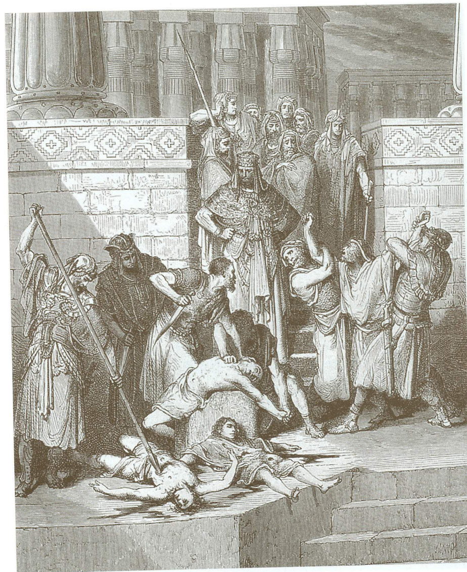
Nebukadnetsari käsul mõrvatakse Sedekia silme all tema pojad (Gustave Doré)

Abigaille'i nurjatuid plaane segab Nabucco ootamatu naasmine. Kuningas ei tunnista kedagi endast võimsamat ja kuulutab ennast jumalaks. Nende teotavate sõnade juures rebitakse tal kroon peast ning ta kaotab mõistuse. Troonile asub Abigaille.