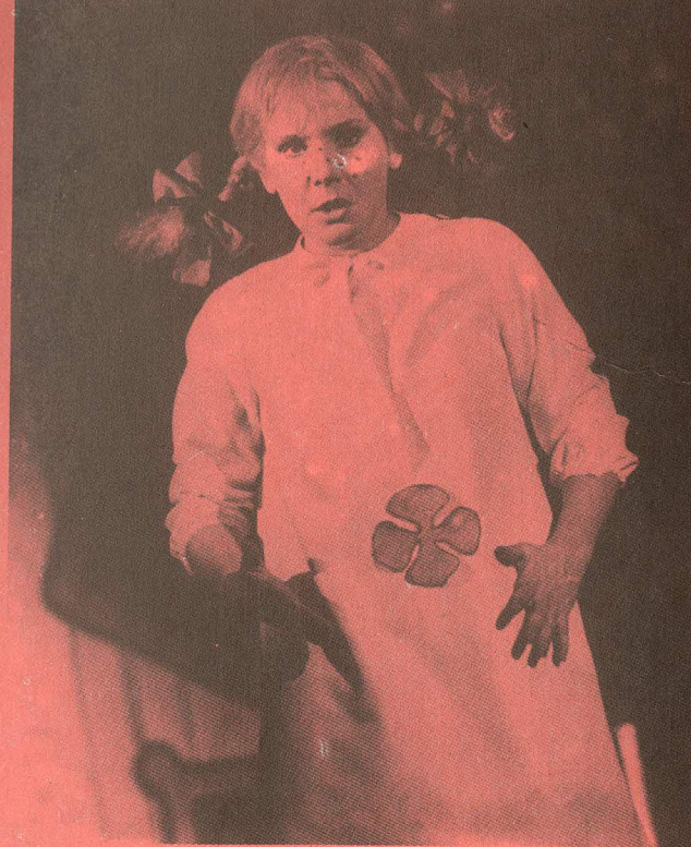
Lilli Vanessi Leedi Macbethina

LILLI VANESSI on pärast edukat filmistaarikarjääri taas teatrilaval! Kes ei mäletaks tema Rose-Marie'd, Marizat, Sallyt Broadwaylt?! Tema muusikalised filmid «Leedi Macbeth ja vampiir» jt. kuuluvad filmikunsti kullafondi. Unistustemaaks on primadonnale olnud aga ikka ja jälle Shakespeare'i uhked kangelannad.