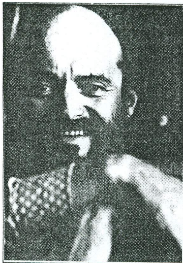
Arvo Pärt saabus Tallinna eile.