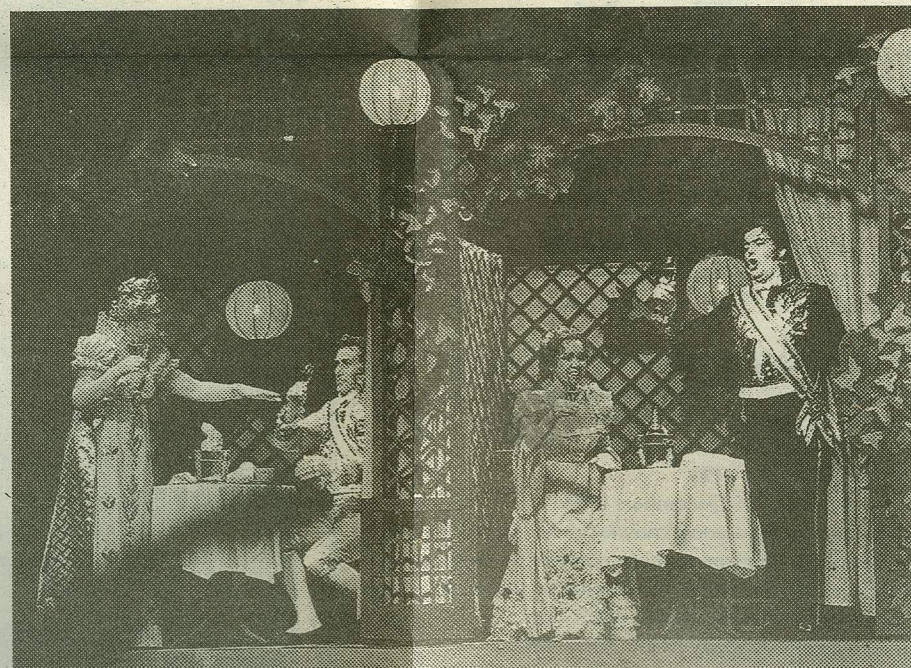
PUBLIK ARMASTAB, KÜLASTAJA NAUDIB: Estonia teater on "Viini Vere" näol saanud repertuaari menuartiklil.

Klassitsismist arenes välja ka rahvalik biidermeier ning selles stiilis on kujundatud I ja III vaatus, ehk vastavalt suvevilla interjööri ning rahvapeo lavapilt. Suvevilla elutoas(?) jääb igatahes puudu intiimsetest nipsasjakestest ja puhkemööblist, mida sellistesse ruumidesse kuhjus alati küllaga. Praegu, kui kujundaja on teinud panuse stiilsusele, jätab I vaatuse rõõmsameelne lavapilt siiski lõpetamata mulje. Aga tantsustseenidele jätkub seal vist parajasti ruumi. Samad sõnad ütlesin viimase vaatuse kohta: õine lehtlapilt võimaldaks romantilisemat peisaazhi, lehtlavõrestikud on