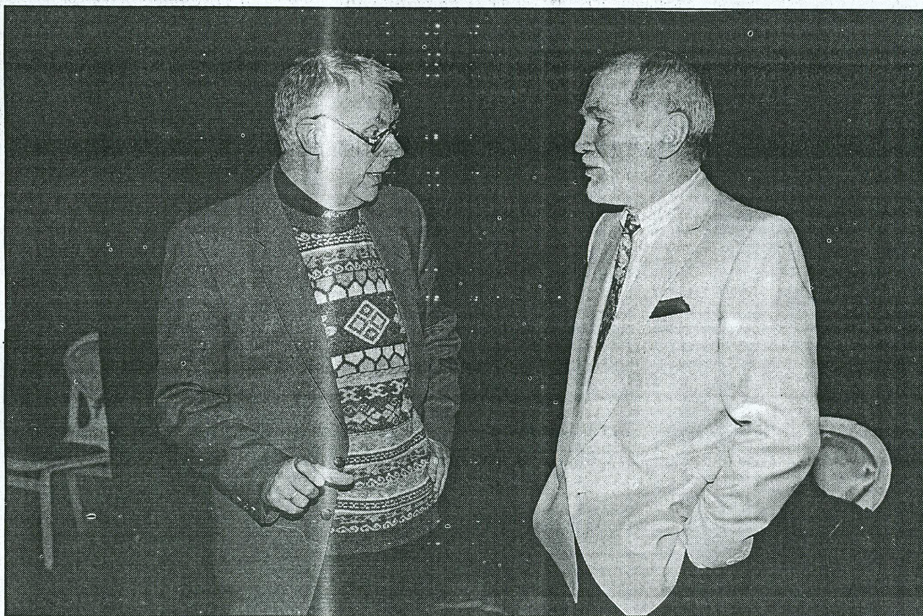
• "Mul on hea meel, et ooperi lavastab MIKK MIKIVER — sisemiselt väga musikaalne inimene," tõdeb rõõmuga ooperi "Cyrano de Bergerac" autor EINO TAMBERG.