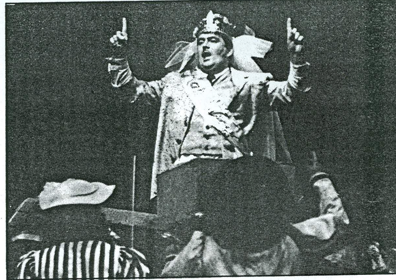
Peaosas on Mati Kõrts.