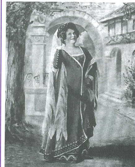
Frieda Hempel as Frau Fluth at the Berlin Royal Opera, 1907.

Although Nicolai composed a number of operas, "Die lustigen Weiber von Windsor" is by far the most successful. A popular national style, felicitous melodies and a genuinely comic situation combine with polished and consistently worked-out ensembles and finales to produce a masterpiece, the culmination of the composer's creative activity.