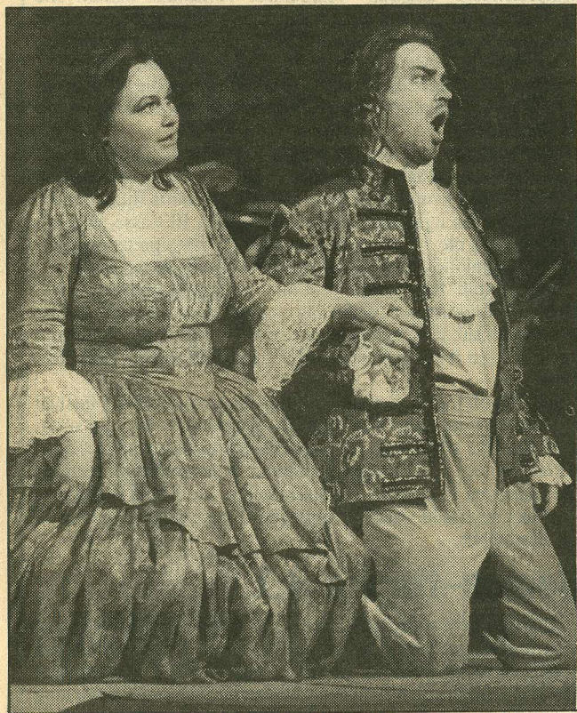
... Hakkabki. Figaro ja tema mõrjsa Susanna on teineteist leidnud.

jäle! Seda ei mängita iial!" olla Louis XVI öelnud Beaumarchais' näidendi "Figaro pulm" kohta. Ometi mängiti seda juba tookord, ja mängitakse siiani.