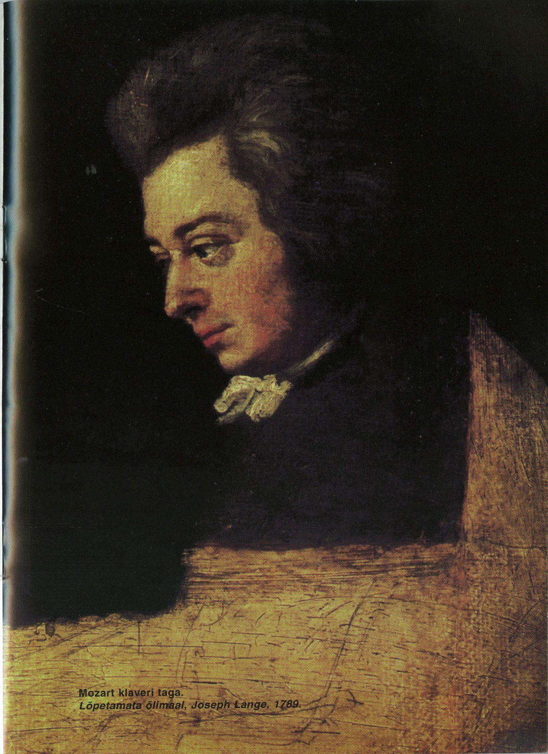
Mozart klaveri taga. Lõpetamata õlimaal, Joseph Lange, 1789.