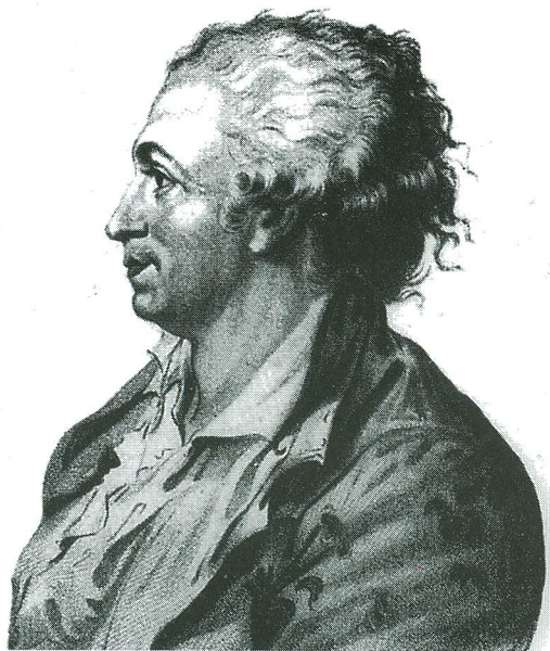
Pierre Augustin Caron de Beaumarchais. Vasegravüür.