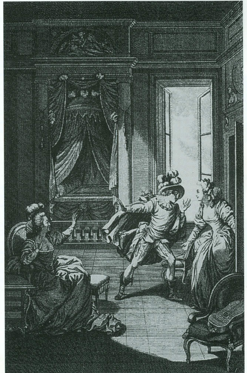
Raamatuillustatsioonid Beaumarchais' näidendi "Figaro" esmatrükile. Vasegravüür, Christian von Mechel, 1785.

Sel ajal kui daamid Cherubinot ümber riietavad, kostub koputus uksele ja krahv nõuab sisselaskmist. Krahv, ärritatud saadud kirjast, on kindel, et leiab suletud ukse tagant oma naise armsama. Cherubinol ei jää muud võimalust kui põgeneda läbi akna. Kui uks avatakse, ilmub nii krahvi kui krahvinna üllatuseks toast Susanna. Nüüd on krahv sunnitud krahvinnalt andestust paluma ja naised omakorda tunnistavad üles pettuse kirjaga. Ilmub pahane aednik Antonio teatades, et keegi hüppas aknast välja otse tema lillepeenrassa. Õnneks võtab Figaro süü