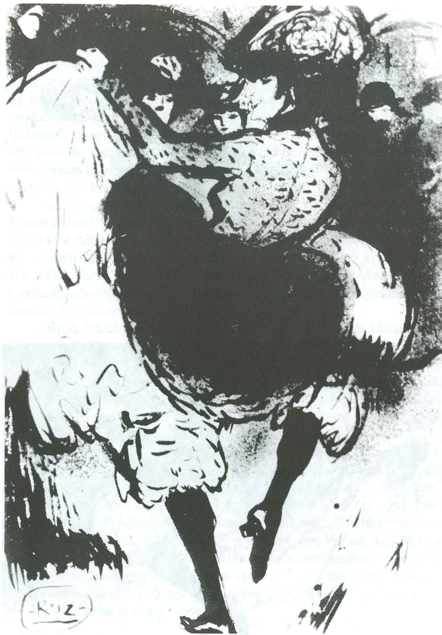
Pablo Picasso, Ballerina di Cancan , 1900.

1937. aastal elas Porter läbi autoõnnetuse, mille tulemusel ta kaotas ühe jala. Järgmisest kümnest aastast pole midagi rääkida - õnnetuse demoraliseerivad tagajärjed ja loodetud edu tulemata jäämine panid tema võimekuse kahtluse alla. Ent 1948. aastal valmis Porteri meistriteos - muusikal "Kiss me, Kate" (Estonia Teatris kahel korral lavastatud). Hilisematest teostest sai populaarseks vaid muusikal "Can-Can" (1953) ning mõned Hollywoodi tarvis kirjutatud laulud. Pärast abikaasa surma 1954. aastal elas Cole Porter erakuna New Yorgis.