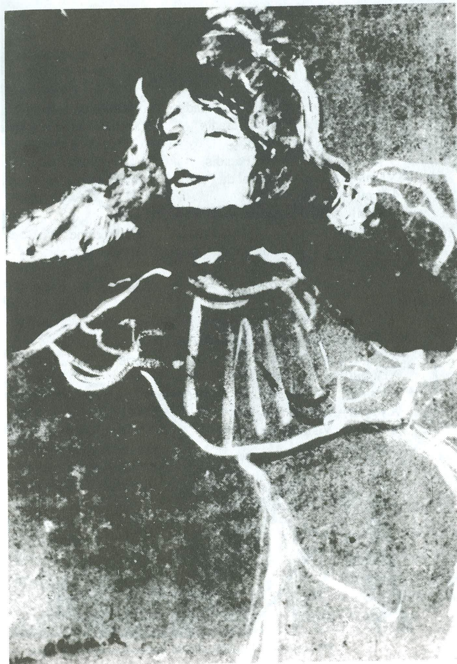
Henri de Toulouse-Lautrec, Yvette Guilbert, 1894